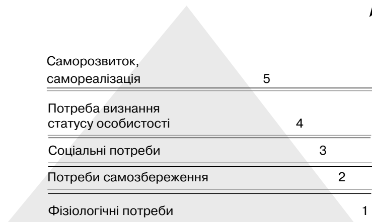
Піраміда потреб (за А. Маслоу)

Соціальні та економічні права часто розглядають разом, тому що їх перелік та реалізація залежать від рівня розвитку суспільства та економіки країни. До цих прав насамперед належать: право на достатній рівень життя; право на відпочинок і дозвілля; право на охорону здоров'я. Реалізація цих прав неможлива без комплексу трудових